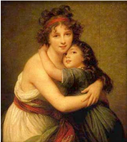
Elisabeth Vigée-Lebrun - Elisabeth e Julie - 1789

esplicitato fino in fondo tra le madri e le non madri. Non so dire se questo conflitto esiste veramente, se sia immaginario o reale nelle nostre menti, certo è che anche quelle norme di tutela non aiutano a dipanarlo.